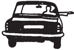
ਸੱਜੇ ਹੱਥ ਮੁੜਨ ਲਈ ਪੈਰਾ 5.2.1