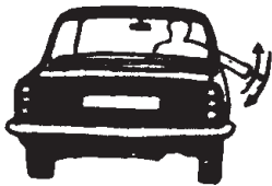
ਰਫਤਾਰ ਹੌਲੀ ਕਰਨ ਲਈ ਪੈਰਾ 5.2.3