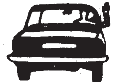
ਕੱਢੀ ਖੜੀ ਕਰਨ ਲਈ ਪੈਰਾ 5.2.4